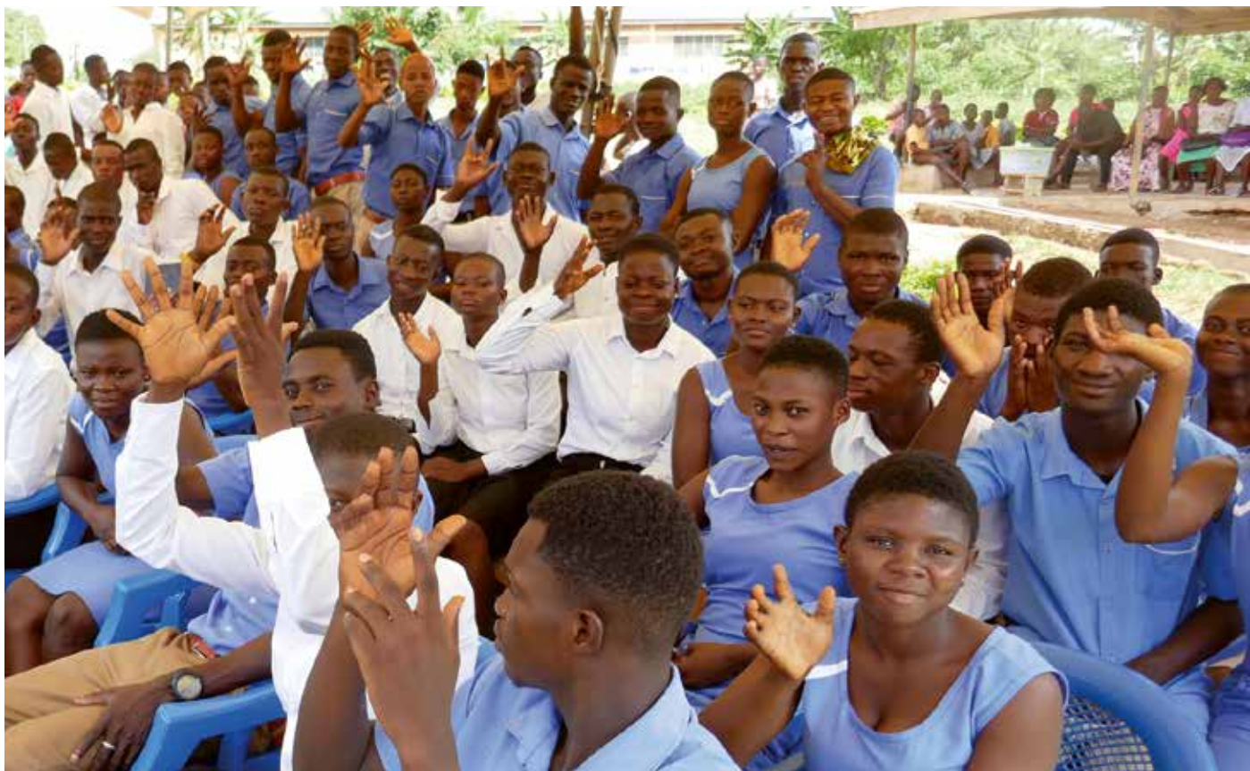
Die „Bechem School for the Deaf“ in Ghana bildet gehörlose junge Menschen in Handwerksberufen aus.